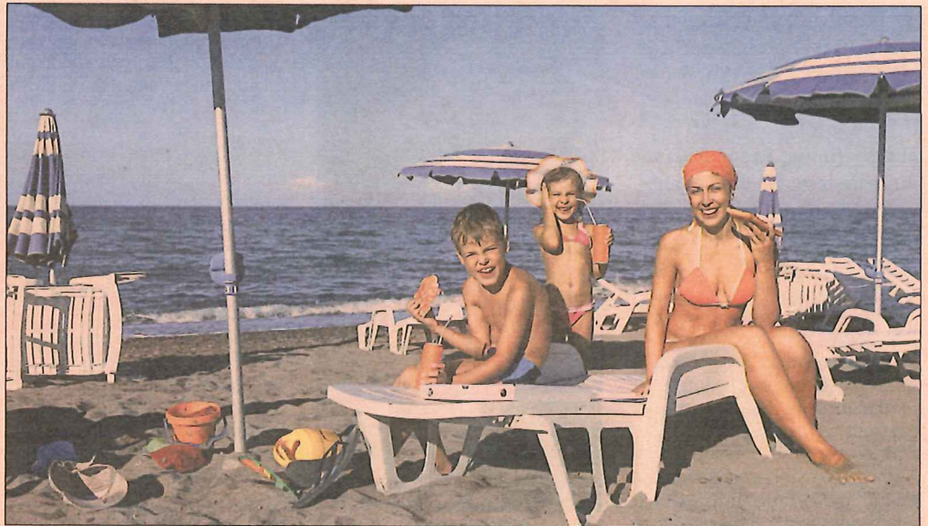
Der Urlaub ist eine wichtige Zeit für die gesamte Familie: Erstmals steht dem Verbraucher nun ein Schadenersatz für entgangene Urlaubsfreuden zu.

Zunächst aber ein Blick auf die Pauschalreisen : Bisher waren diese Bestimmungen im Gesetzbuch für den Verbraucherschutz zu finden, doch nun sind sie un-