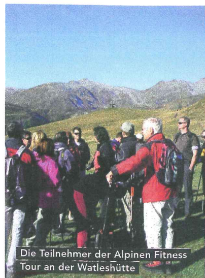
Die Teilnehmer der Alpinen Fitness Tour an der Watleshütte