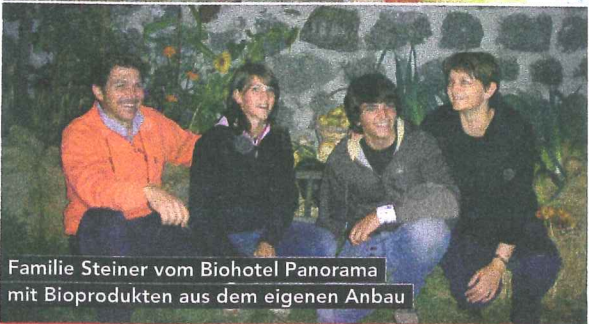
Familie Steiner vom Biohotel Panorama mit Bioprodukten aus dem eigenen Anbau